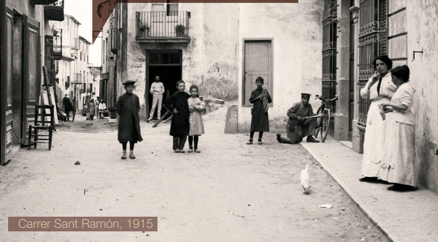
Carrer Sant Ramon, 1915

Us proposem un recorregut per les seves places i carrers on hi trobareu uns suports amb una breu síntesi dels edificis, personatges i oficis que han marcat el caràcter de la vila i uns codis QR que podreu capturar amb un dispositiu mòbil i que us ampliarà aquesta informació i us transportarà a un passat que ens ajudarà a entendre millor el present i a projectar-nos cap al futur.