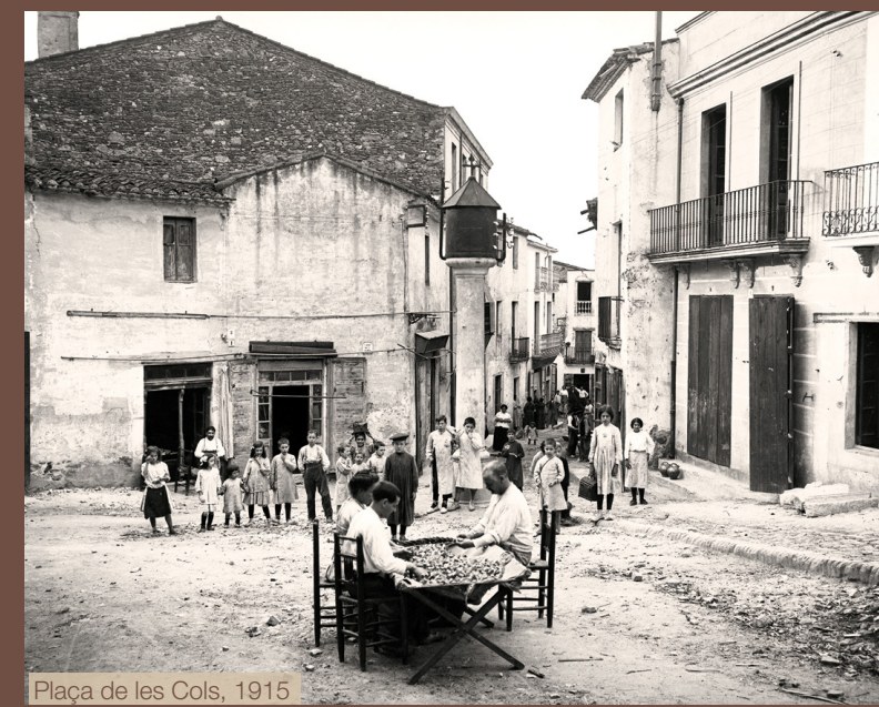
Plaça de les Cols, 1915

Aquesta plaça ha estat sempre un espai molt lligat al Teatre Clavé, així com l'antiga casa del ferrer, ara enderrocada. Va ser comprat per l'Ajuntament l'any 1983. El 23 de desembre del 1987 el ple de l'Ajuntament de Tordera va aprovar convocar un concurs d'idees per a la redacció del que esdevindria l'espai escènic municipal i l'edifici antic es va enderrocar l'any següent. Les obres del nou Teatre Clavé s'inicien el juny del 1991, poc després que el ministre de cultura d'aleshores, Jordi Solé Tura, fes la col·locació simbòlica de la primera pedra de l'equipament el 26 d'abril d'aquell mateix any. El nou edifici es va inaugurar definitivament l'any 1999. A prop seu hi trobem curiosament personatges relacionats amb les arts escèniques, com són el tenor Emili Vendrell i Pere Domingo, avi del també tenor Plácido Domingo. També hi havia a prop dos edificis ja desapareguts relacionats amb l'oci i la cultura: els locals dels Tranquils i de l'Amistat.