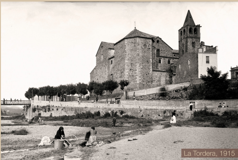
La Tordera, 1915

Casa d'indians construïda per encàrrec de la família Freixes, que la va vendre posteriorment a l'indià Narcís Forts Borrell. Té la peculiaritat de ser de les poques cases de la població d'aquest estil. Durant la Guerra Civil fou utilitzada pel comitè i com a hospital. El caràcter senyorial de l'edificació,